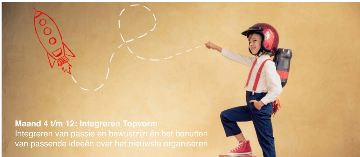
Maand 4 t/m 12: Integreren Topvorm Integreren van passie en bewustzijn én het benutten van passende ideeën over het nieuwste organiseren