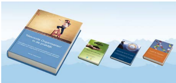
Gepassioneerd en succesvol door een kraakheldere visie